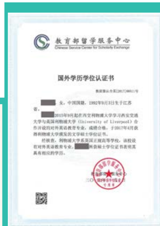
教育部留学服务中心学历认证证书样本

“XJTLU’s vision exemplifies China’s ideal to create partnerships of equals in higher education. XJTLU aims to blend the strength of the Chinese and UK higher education systems.”