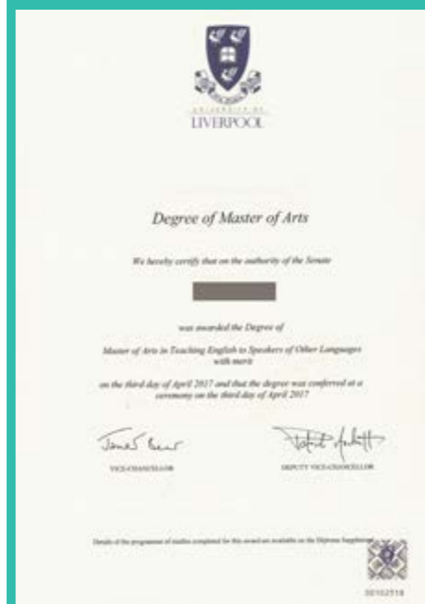
英国利物浦大学硕士学位证书

西浦课程严格按照质量保证体系进行设置，符合英国高等教育质量保障署标准。同时，高水准的教学团队和全球选聘的国际知名学者，也是我校教学质量的有力保障。