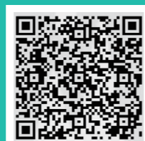
研究生招生咨询QQ群