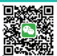
西浦招生微信公众号

本折页所述要求更新于 2022 年 6 月，仅供 2022 年入学的申请者参考。详细的申请要求与流程，请访问大学官网：www.xjtlu.edu.cn