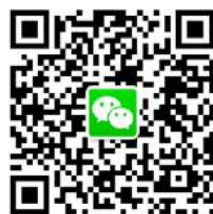
西交利物浦大学校友会