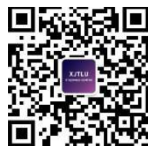
西浦 IT 服务中心