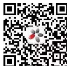
西浦学生心理咨询中心