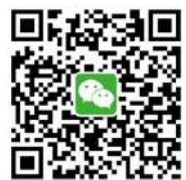
图书馆微信公众号