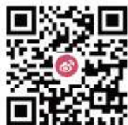
西交利物浦大学校友会