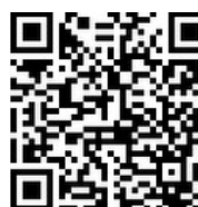
西浦学生事务办公室微博