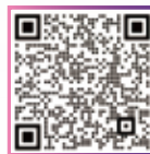
扫描以上二维码 获得 EdD 项目招生官方微信联系方式