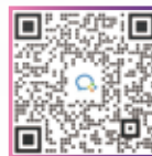
扫描以上二维码 加入 EdD 项目微信群